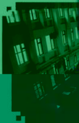
CNC 数控技术 训练场所